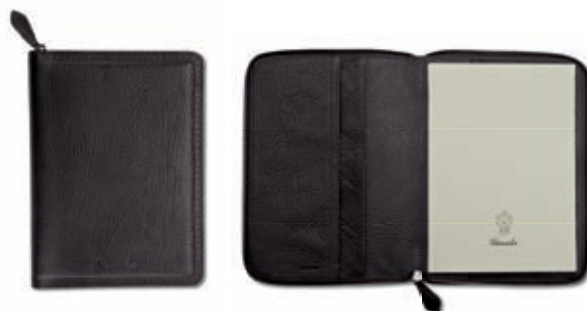
Agenda 17x24 settimanale con zip Diary 17x24 - weekly with zip-around 20x27.5x2.5 cm cod. M10301 vitello rugato - ebano 245 rugato calfskin - ebony 245