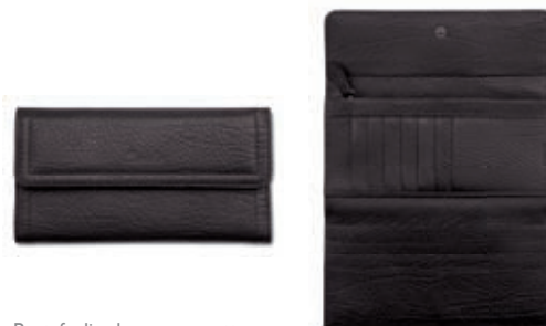
Portafoglio donna con patta Women's wallet with flap 19x10.5x1.5 cm cod. M10505 vitello rugato - ebano 245 rugato calfskin - ebony 245