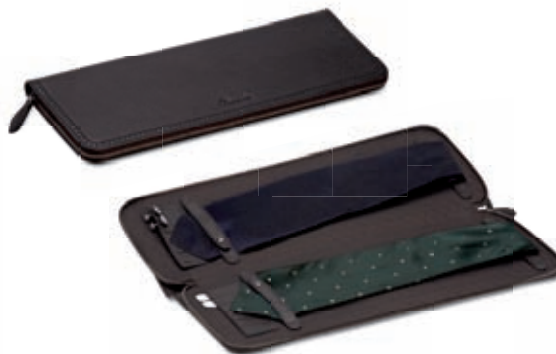
Porta cravatte Tie holder 50x16x2 cm cod. MI0210 vitello rugato - ebano 245 rugato calfskin - ebony 245 cod. MC0210 tessuto spalmato e pelle - nero/ebano 257 coated canvas and leather - black/ebony 257