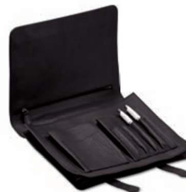
Sottobraccio Underarm document case 39x27x5 cm cod. MI0106 vitello rugato - ebano 245 rugato calfskin - ebony 245 cod. MC0106 tessuto spalmato e pelle - nero/ebano 257 coated canvas and leather - black/ebony 257