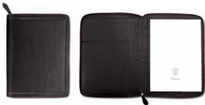
Portablocco A4 con zip A4 notepad holder with zip-around 25.5x34x1.5 cm cod. M10302 vitello rugato - ebano 245 rugato calfskin - ebony 245