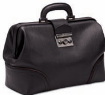
Borsa medico media Doctor bag - medium 35x27x15 cm cod. MI0108 vitello rugato - ebano 245 rugato calfskin - ebony 245 cod. MC0108 tessuto spalmato e pelle - nero/ebano 257 coated canvas and leather - black/ebony 257