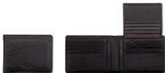
Portafoglio uomo con ribaltina porta carte di credito Men's bi-fold wallet with flap with extra credit card slots 12.5x9.5x1 cm cod. M10502 vitello rugato - ebano 245 rugato calfskin - ebony 245