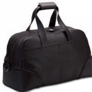
Sacca viaggio Travel bag 49x29x23 cm cod. MI0205 vitello rugato - ebano 245 rugato calfskin - ebony 245 cod. MC0205 tessuto spalmato e pelle - nero/ebano 257 coated canvas and leather - black/ebony 257