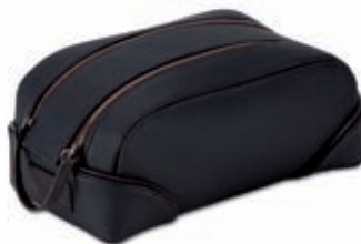
Beauty grande Beauty case - large 27x7x15 cm cod. MI0209 vitello rugato - ebano 245 rugato calfskin - ebony 245 cod. MC0209 tessuto spalmato e pelle - nero/ebano 257 coated canvas and leather - black/ebony 257