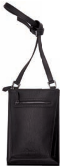
Postino Messenger bag 21x29.5x4 cm cod. MI0111 vitello rugato - ebano 245 rugato calfskin - ebony 245 cod. MC0111 tessuto spalmato e pelle - nero/ebano 257 coated canvas and leather - black/ebony 257