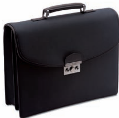
Cartella 2 soffiatti Briefcase - 2 gussets 42x32.5x9.5 cm cod. MI0101 vitello rugato - ebano 245 rugato calfskin - ebony 245 cod. MC0101 tessuto spalmato e pelle - nero/ebano 257 coated canvas and leather - black/ebony 257