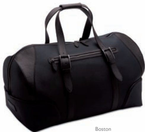
Boston Boston bag 58x32x32 cm cod. MI0203 vitello rugato - ebano 245 rugato calfskin - ebony 245 cod. MC0203 tessuto spalmato e pelle - nero/ebano 257 coated canvas and leather - black/ebony 257