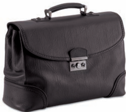
Cartella 3 soffiatti Briefcase - 3 gussets 42.5x30.5x16 cm cod. MI0104 vitello rugato - ebano 245 rugato calfskin - ebony 245 cod. MC0104 tessuto spalmato e pelle - nero/ebano 257 coated canvas and leather - black/ebony 257