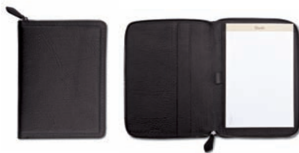
Porta ricettario medico Prescription pad holder 20x27.5x2.5 cm cod. M10402 vitello rugato - ebano 245 rugato calfskin - ebony 245