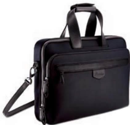
Porta computer Computer case 40x28x9 cm cod. MI0103 vitello rugato - ebano 245 rugato calfskin - ebony 245 cod. MC0103 tessuto spalmato e pelle - nero/ebano 257 coated canvas and leather - black/ebony 257